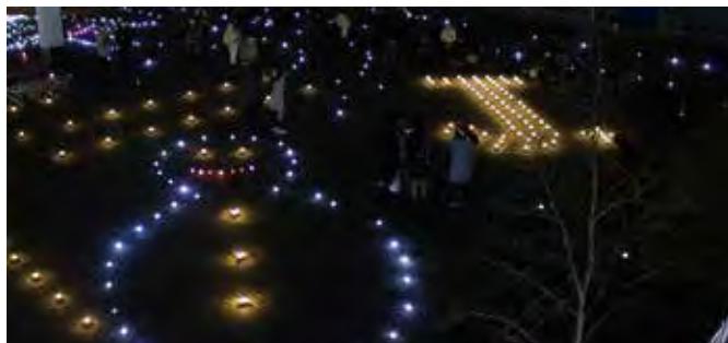
◀八木山イルミネーション アート・プロジェクト