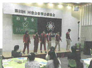
ダンス部のパフォーマンス